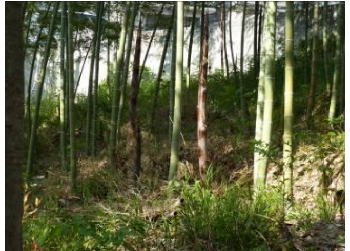
孟宗竹のタケノコ