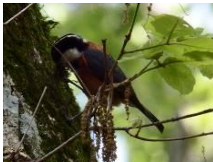
巣材のコケを集めるヤマガラ