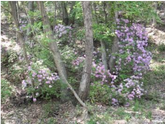
満開のモチツツジ