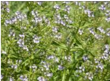
オオカワヂシャの花