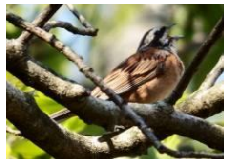
さえずり中のホオジロ