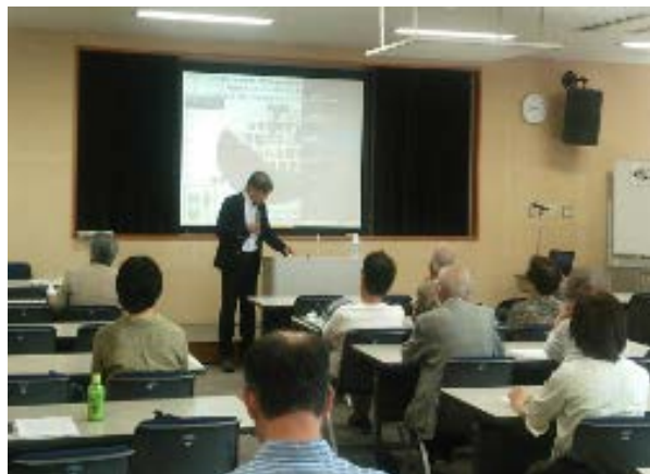
5月21日の実施の様子