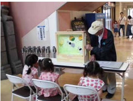
環境紙芝居の実演

エコウイングが主催して行われた環境フェアが、6月11日(土)、12日(日)にイオン明石ショッピングセンターの海の広場でありましたが、エネルギーグループは12日に出席しました。